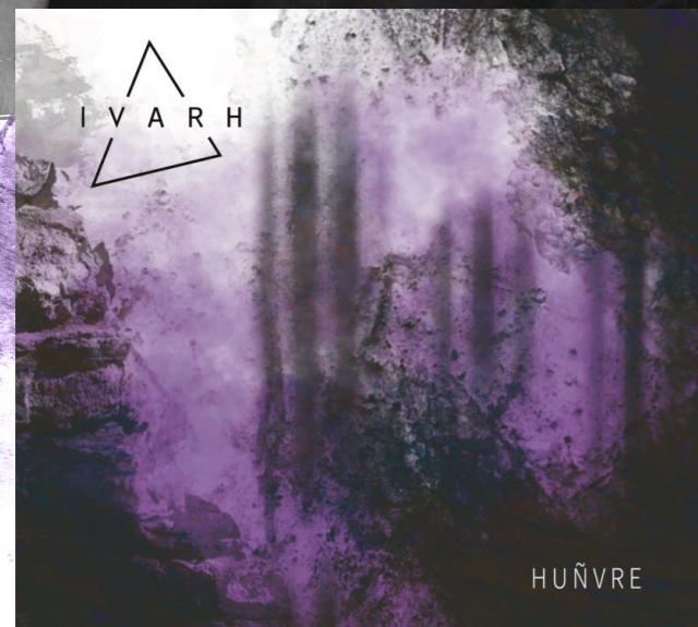
PLADENN NEVEZ Embann e miz Here